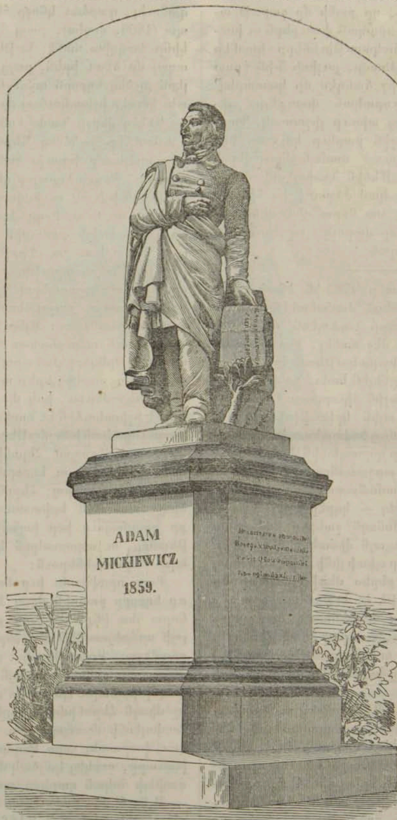
Ադամ Միքեւիչ, Բերրոյ Անաջի.