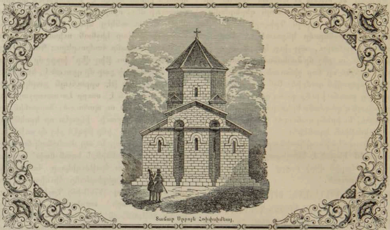
Տաճար Սրբոյն Հռիփսիմայ.

մանայ սրտին մէջ հեռաւոր աշխարհքէ եկող ուխտաւոր Հայը, երբոր կերթայ այն մեծ վրկայունոյն իբրեւ մօր սիրելոյ խոնարհ շիրիմը՝ երեսի վրայ ընկած կիամբուրէ, ու յե-