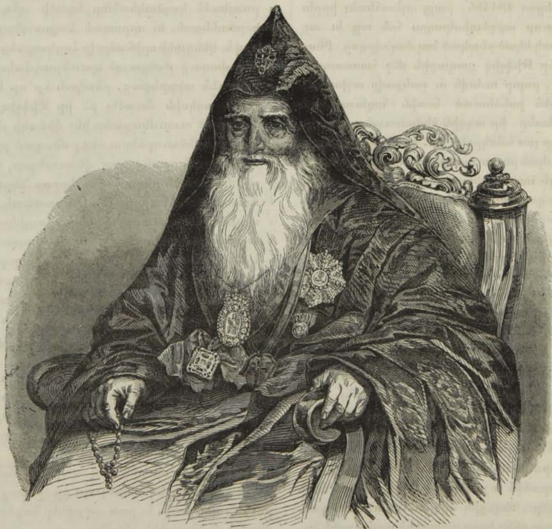
Տէր Ներսես սրբազան Կարուղիկոս ամենայն Հայոց

« փայլ ձիրքերը տեսնելով՝ վարդապետական « աստիճան տուաւ անոր, ետքն ալ եպիսկոպոս « ձեռնադրեց : Մինչեւ այն ժամանակը Ներսեսի « գործունեութիւնը էջմիածնի խաղաղաւետ պա- « տերուն մէջ ամփոփուած էր. քիչ ատենէն « ընդարձակ ասպարեզ բացուեցաւ առջեւը : « Կարուղիկոսը 1802ին յուղարկեց զինքը ի Վրաս- « տան. հոն Պարսից ու Ռուսաց մէջ բոբրոքած